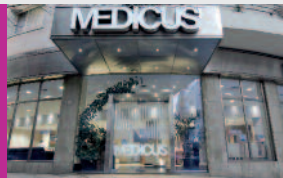
CENTRO MEDICUS RETIRO

Cuba 1886, Capital Federal - Tel.: 5786-0277 Atención: Lun a Vie de 8 a 20 hs., Sáb de 8 a 13 hs.