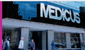
CENTRO MEDICUS AZCUENAGA

En MEDICUS, nuestros asociados cuentan con la atención médica primaria y exclusiva de los CENTROS MEDICUS