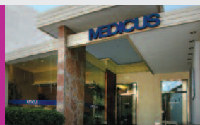
CENTRO MEDICUS LOMAS DE ZAMORA

Arroyo 807, Capital Federal - Tel.: 4328-1285 Atención: Lun a Vie de 8 a 20 hs.