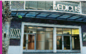
CENTRO MEDICUS BELGRANO

Azcuénaga 910, Capital Federal - Tel.: 4129-5300 Atención: Las 24 hs. de los 365 días del año